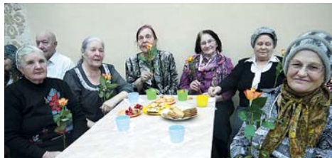
На фото: Розы в благодарность мамам и бабушкам за то, что они есть

В ноябре в Домах культуры п. Мичуринский и п. Элитный состоялись праздничные мероприятия, посвященные Дню матери.