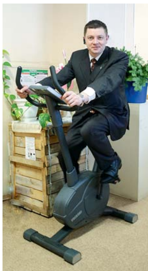
На фото: Первая проба велотренажера

Награждение победителей акции состоялось 22 ноября в рамках II Сибирского молодежного экологического форума «Патриотизм. Экология. Лидерство». Главный приз — велотренажер. Его решили установить в оздоровительном комплексе п. Мичуринский (ул. Солнечная, 5 а). «Разрядка» должна стать полноценной экологической программой. Теперь сбор отработанных батареек и мобильных телефонов будут производить на постоянной