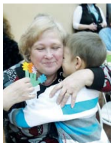
На фото: Рукотворные подарки любимым мамам