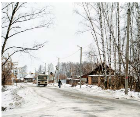
На фото: На ул. Лесная в Мичуринском провели уличное освещение и отремонтировали дорогу

Основной акцент был сделан на ремонт и содержание дорог. Кроме реконструкции дорожного покрытия и оборудования тротуаров на ул. Молодежной в п. Элитный, о котором мы уже писали (см. «СД» №2 (5) август 2013 года), там же была отремонтирована ул. Казарина и восстановлено уличное освещение на ней. В Юном Ленинце асфальт положили от ул. Юбилейной по Речному спуску, а в Мичуринском отремонтировали дорогу