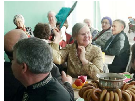
На фото: Веселое знакомство участников вечера

С 1 по 10 декабря в стране традиционно проходит Декада людей с ограниченными возможностями. В эти дни везде встречаются и приветствуют самых сильных, устремленных людей — людей, начавших жизнь заново, понимающих, как эта жизнь дорога, какой бы она ни была. Не остался в стороне и Дом культуры п. Мичуринский.