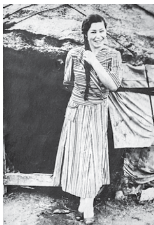
На фото: У дверей своей первой квартиры — юрты