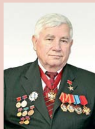
Юрий БУГАКОВ, депутат Законодательного собрания Новосибирской области