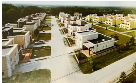
На фото: Концепция застройки, предложенная ОАО «Катрен»