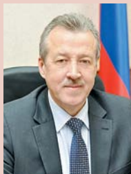
Василий БОРМАТОВ, глава Новосибирского района